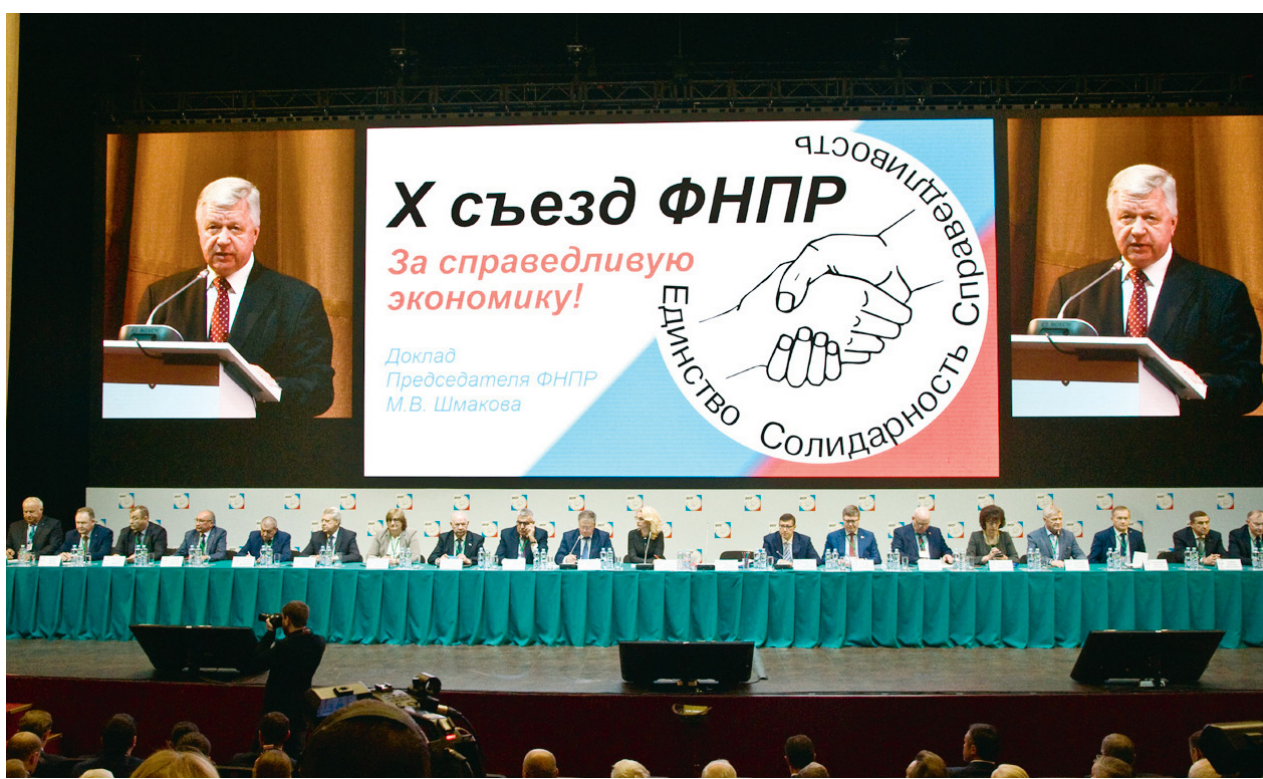
X съезд Федерации Независимых Профсоюзов России