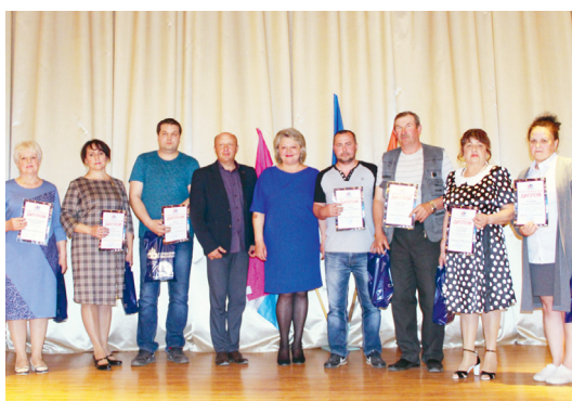
Славим Человека Труда