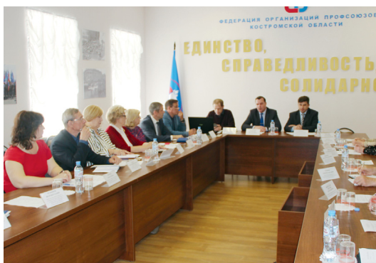
Борьба с серыми зарплатами