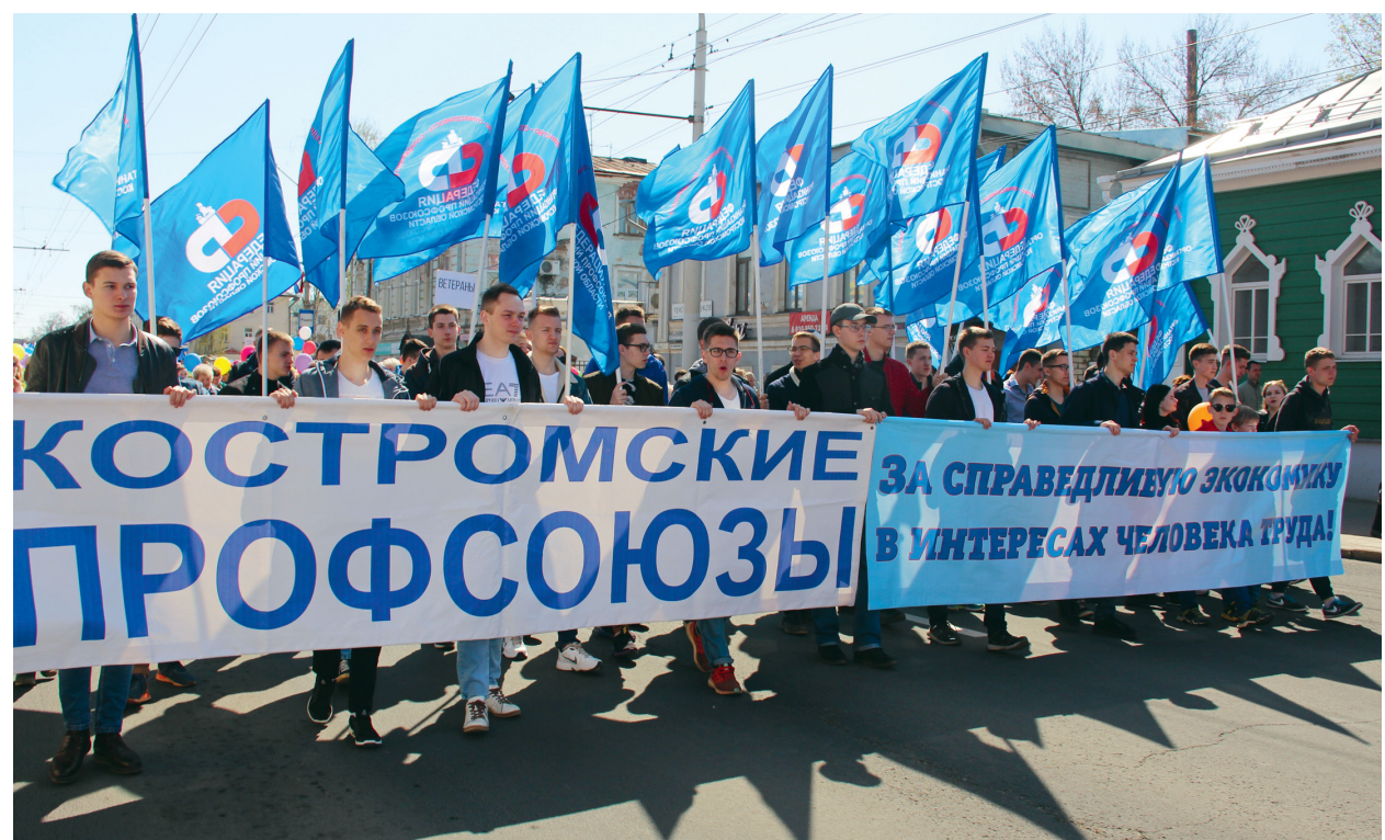
Как Костромская область отпраздновала Первомай