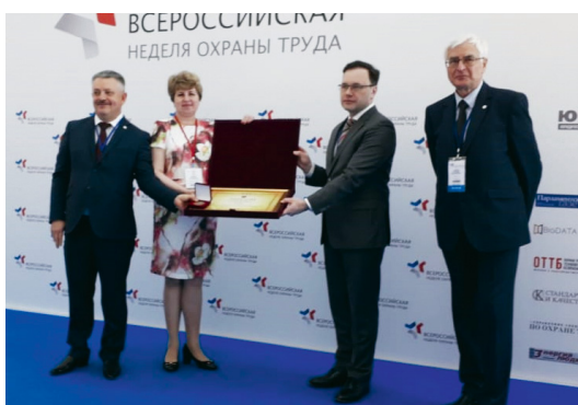
Успех и безопасность