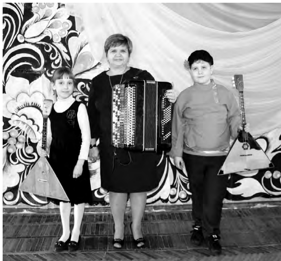
ХОТЕЛОСЬ БЫ, ЧТОБЫ НАШ ТРУД ДОСТОЙНО ОЦЕНИВАЛСЯ. И ТОГДА МУЗЫКАЛЬНЫЕ ШКОЛЫ ОБЛАСТИ ПОПОЛНЯТСЯ МОЛОДЬИМИ СПЕЦИАЛИСТАМИ.

школы активно участвуют в её жизни, выступают на районных мероприятиях, показывают свое мастерство на различных конкурсах. Выпускники с теплотой вспоминают школу, поддерживают с ней связь, сами вливаются в ряды преподавателей.